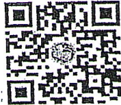
เอกสารแนบ ๒

สำนักงานจังหวัดนครราชสีมา กลุ่มงานบริหารทรัพยากรบุคคล โทรศัพท์ ๐๔๔๒๔๓๐๘๐