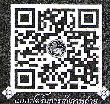
แบบฟอร์มการส่งภาพถ่าย

เชิญชวนประชาชนร่วมส่งภาพถ่ายความประทับใจ ภาพพระบาทสมเด็จพระเจ้าอยู่หัว ณ อาคารบ้านเรือนของตนเอง