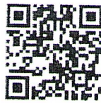
ระบบการเสนอขอพระราชทานฯ

๓) มอบหมายเจ้าหน้าที่ผู้รับผิดชอบ ดำเนินการยื่นคำขอให้บุคลากรในสังกัดผ่านระบบการเสนอขอพระราชทานเหรียญพิทักษ์เสรีชน ปค. ได้ที่ http://mis4.dopa.go.th/0301/decoration ตั้งแต่วันที่ ๑ - ๒๔ พฤษภาคม ๒๕๖๗ พร้อมรวบรวมเอกสารประกอบการเสนอขอพระราชทานฯ ทั้งนี้ สำหรับชื่อผู้ใช้งาน (Username) และรหัสผ่าน (Password) เป็นชื่อผู้ใช้งานเดียวกันกับการเสนอขอพระราชทานเครื่องราชอิสริยาภรณ์และเหรียญจักรพรรดิมาลา ประจำปี พ.ศ. ๒๕๖๗