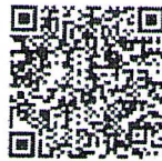
ช่องทางการจัดส่งเอกสารฯ

๔) จัดส่งรายชื่อผู้สมควรได้รับการเสนอขอพระราชทานเหรียญพิทักษ์เสรีชน พร้อมหนังสือ นำส่ง และเอกสารประกอบการเสนอขอพระราชทานเหรียญพิทักษ์เสรีชน ครั้งที่ ๒ ประจำปี พ.ศ. ๒๕๖๗ ให้สำนักงานเลขาธิการกรม กรมการปกครอง ภายในวันที่ ๓๑ พฤษภาคม ๒๕๖๗ ผ่านช่องทาง Google Forms ตาม QR Code “ช่องทางจัดส่งเอกสารฯ” ในรูปแบบไฟล์ PDF สำหรับหนังสือฉบับจริง ขอให้ สำนัก/กอง และที่ทำการปกครองจังหวัด เก็บรักษาไว้ที่หน่วยงานต้นสังกัดเพื่อใช้เป็นหลักฐานในกรณีที่มีความจำเป็นต้องตรวจสอบ